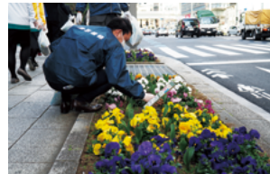
中央通りの歩道上の花壇

また、NPO法人中央区森の応援団とも協業し、「中央区の森」の間伐材でプランターカバーを作製し、NPO法人はな街道を通じて、建設現場の歩道上に約100台設置するなど、まちの美化に貢献しています。