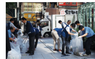
朝の清掃活動の様子

当社グループは、東京建物本社がある八重洲・日本橋・京橋地域をはじめとする複数の地域において、まちの美化のため、業務開始前の時間等を活用し、清掃活動を定期的に行っています。この活動が評価され、日本橋清掃事業協力会から感謝状をいただきました。