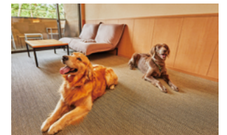
レジャーリゾート箱根雲外荘