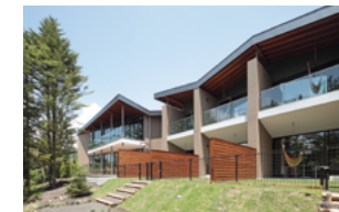
レジャーリゾート軽井沢御影用水

愛犬と安心して宿泊できるリゾートホテルとして新たな観光需要をつくり出し、地域の経済発展に貢献していきます。