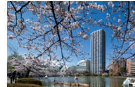
Brillia Tower 上野池之端

た。また、地域の方々の交流の場となるよう、西側街区や旧岩崎庭園と不忍池をつなぐオープンスペースを設けています。