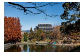
Brillia City 千里津雲台

つなぐことをテーマに廃材アートを配置しました。エントランスのメインアートをはじめとした素材の木材には従前団地の桜の木を利用し、その選定は地権者様に主導していただくなど、様々な施策の結果、新築マンションでありながら歴史を継承し、千里ニュータウンと融和した計画が実現しました。ソフト面でも、公園内でカフェを運営する事業者と連携し、共用部やカフェを会場とした居住者コミュニティ形成プログラムを実施することで本物件と公園、居住者同士のつながりを形成しています。