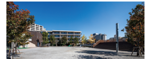
隣接する「おかのう公園」