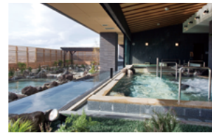
おふろの王様 高座渋谷駅前店

お客様が安心してくつろげる空間の提供を通じて、地域のコミュニケーション活性化や、地域住民の健康増進などに貢献します。