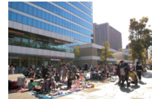
中野セントラルパークで行われたフリーマーケット

「東京スクエアガーデン」では、1階の貫通通路を利用して、新鮮野菜や加工食品を販売する「京橋マルシェ」を2018年8月から定期開催しており、2020年は計16回実施しました。