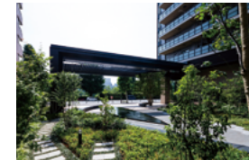
緑に囲まれたオープンスペース