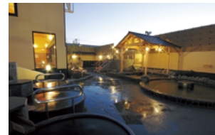
おふろの王様 海老名店