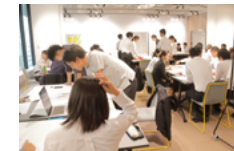
インターンシップの受け入れ

インターンシップを通じた就業体験や学生同士の交流は、学生に、能力向上だけでなく、自分自身の将来について真摯に考える機会を提供することでもあると考えています。また、当社での就業を事前に経験してもらうことで、当社はもとより、不動産業界全体での入社後のミスマッチを減らすことも目的としています。当社は、こうした取り組みが早期離職を未然に防ぎ、若年就業者の育成と定着につながるものと考えています。