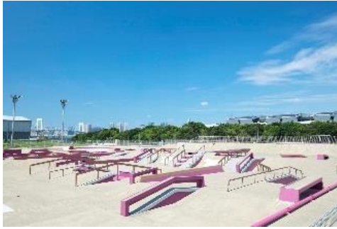
スケートボードパーク