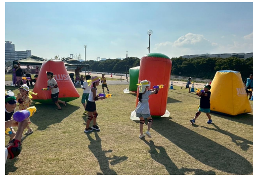
子ども向け水遊びイベントの様子