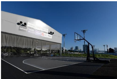
3x3バスケットボールコート