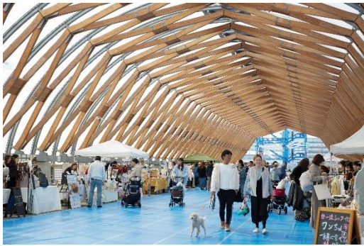
愛犬家向けイベントの様子