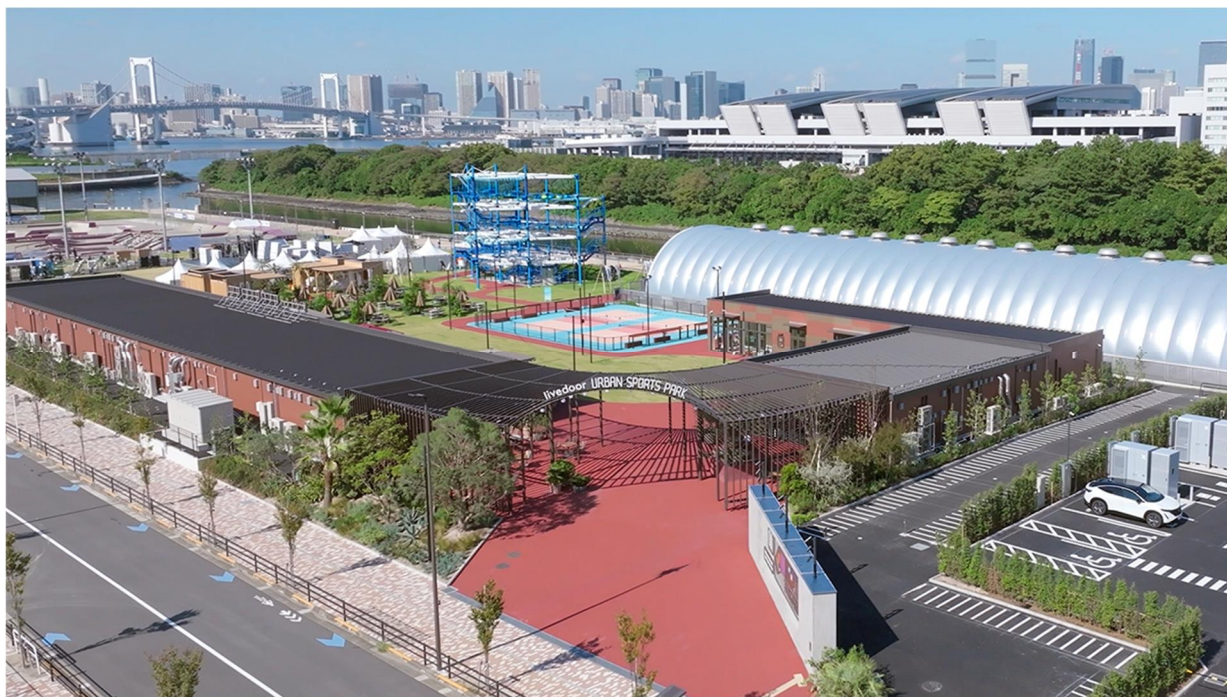
livedoor URBAN SPORTS PARK 外観