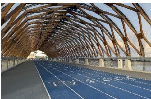
ランニングスタジアム