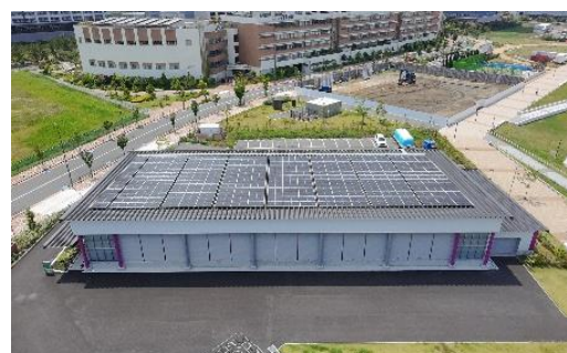
ボルダー棟（上屋根）の太陽光パネル