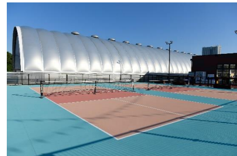
ピククルボールコート