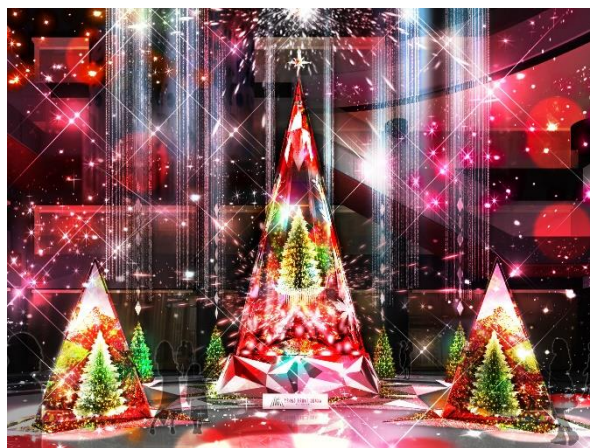
ライティングショー実施(イメージ)