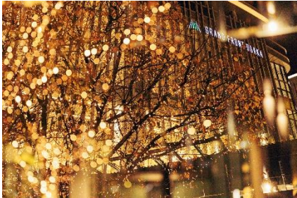
過去実施時の様子

なお、本イベントで使用する電力は、「RE100」※に対応した実質再生可能エネルギー由来となっており(一部エリア除く)、LED 電球も省電力のタイプを採用するなど、環境に配慮したイルミネーションを実現しています。