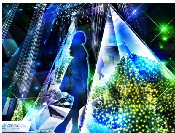
内部の色が変化し、表情を変える「Infinity Wish Tree」(イメージ)