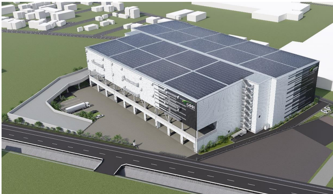
(仮称) T-LOGI 仙台 外観イメージ