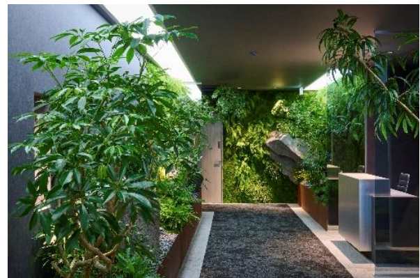
▲グリーンコリドー