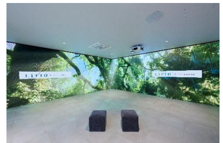
▲イマーシブシアター