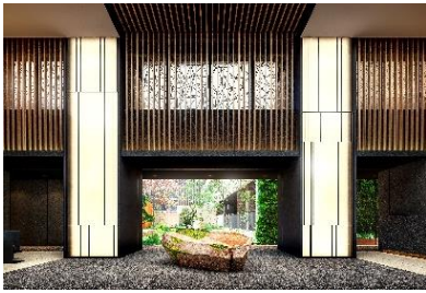
▲エントランスホール