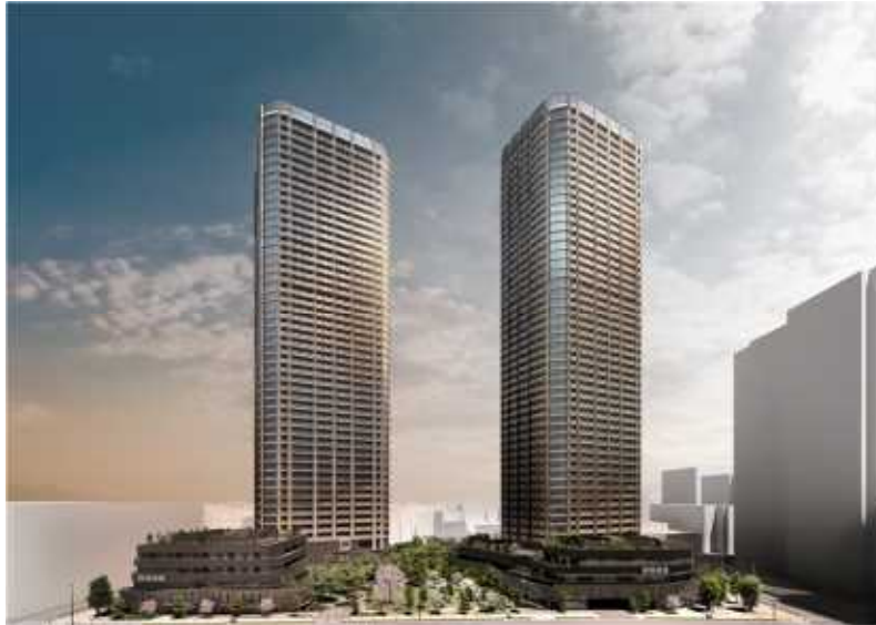
▲ザ・パークハウス 武蔵小杉 Towers 西側外観完成予想 CG

三菱地所レジデンス株式会社、東京建物株式会社、東急株式会社、東急不動産株式会社の4社は、武蔵小杉駅北側エリアの「まち一体型複合開発」における、武蔵小杉最大級2棟1,438戸（サウス719戸、ノース719戸）の地上50階建、免震タワーレジデンス「ザ・パークハウス 武蔵小杉 Towers」（以下、「本物件」）の概要を発表します。また、本物件の魅力を紹介する特設サイトを公開し、タワーレジデンスの新しい暮らし方を提案していきます。