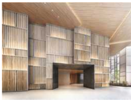
▲グランドエントランス（ノース）完成予想 CG