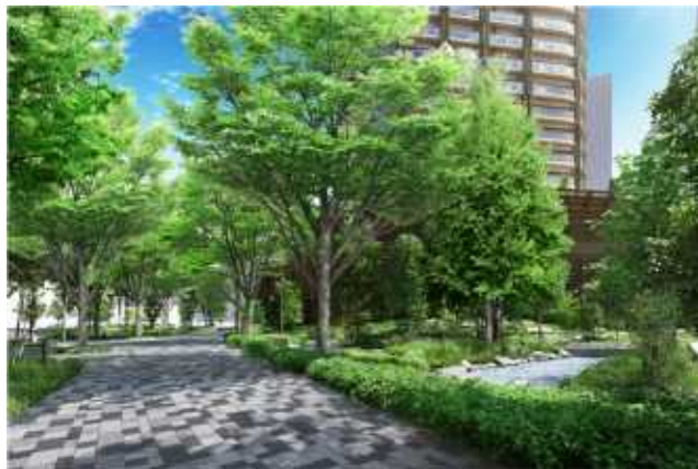
▲コスギプロムナード 完成予想 CG