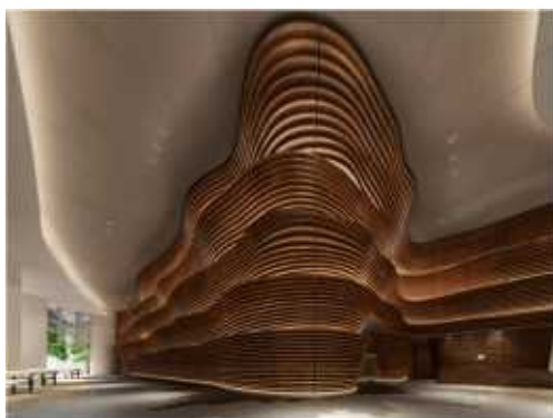
▲グランドエントランス（サウス）完成予想 CG

吹き抜け空間のグランドエントランスは、「サウス」・「ノース」2棟のタワーレジデンス、それぞれテーマの異なるデザインウォールがお出迎えます。サウスのテーマは「躍動」——暮らしを愉しむダイナミズムを描きます。ノースのテーマは「律動」——暮らしを支える規則正しいリズムを描きます。どちらもリズムを刻むように心地よく配列された年輪からは、安らぎや自然の奥行きを身近に感じることができます。