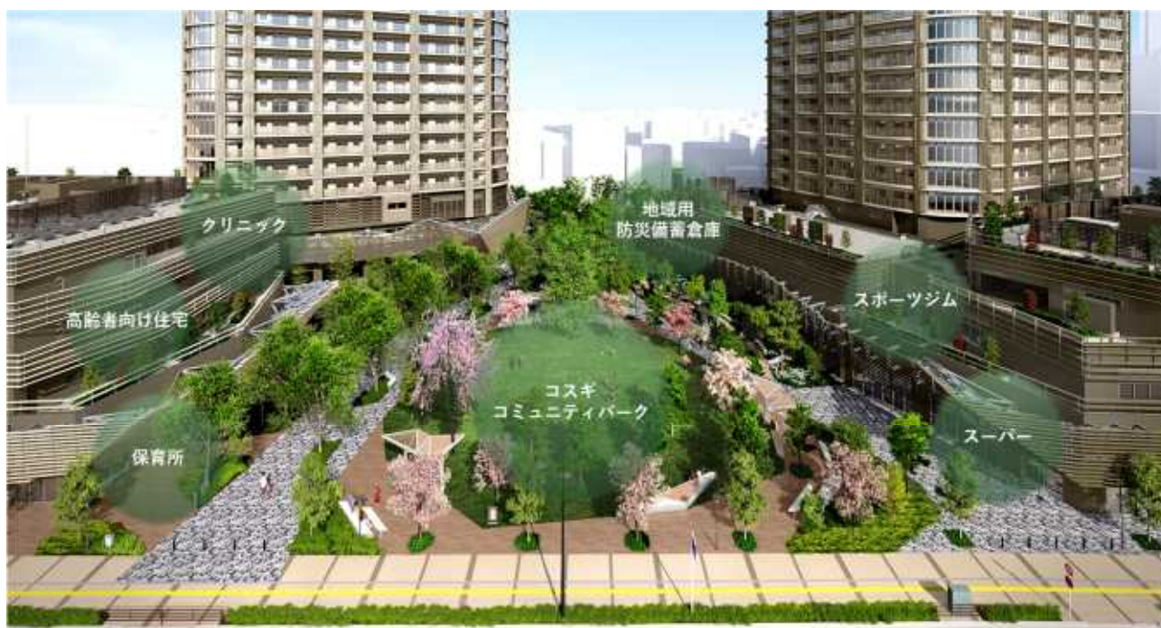
▲施設全体 完成予想 CG

本物件の特長である「まち一体型複合開発」により、入居者が自らのライフステージに応じて、自己の健康増進や子育て、高齢福祉サービスを受けることが可能になり、多様な世代の人々が、生涯にわたって安心して豊かに暮らし続けるための環境を備えました。また、地域に開かれた空間づくりにより、自然を感じ安心できる空間と交流の場を設け、昔からある住宅街の穏やかな暮らしとタワーレジデンスの先進的な暮らしが調和することで、新しい暮らし方を提案いたします。