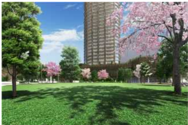
▲コスギコミュニティパーク 完成予想 CG

外観デザインを監修した建築家の隈氏は、「タワーレジデンスは今後、優しく柔らかい空間になってほしい。閉鎖的な空間にするのではなく、外部の人々も気軽に立ち寄れるような開かれた空間を意識しました。」とコメントしています。