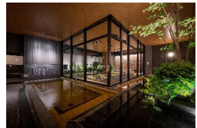
おふろの王様 和光店 (温浴施設事業)

※ イメージ画像や施設情報は、現時点での予定・仮称であり、変更となる場合がございます。