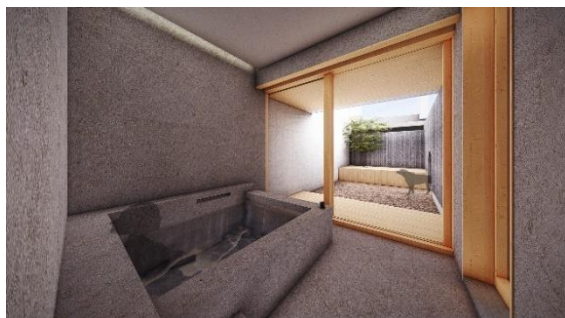
天然温泉（園スイート）

保湿効果が高く、美肌効果も期待できるメタケイ酸を多く含んだ自家源泉の天然温泉が全室で楽しめるほか、「園ラグジュアリースイート」には、プライベートサウナまたは岩盤浴を備えており、プライベートな空間で、心身を深く解きほぐす極上のリラクゼーション体験を提供します。また、「園-Kakoi-」に宿泊のお客様は本館エリアの由布岳を臨む温泉露天風呂「湯の丘」や「貸し切り温泉」も利用いただけます。