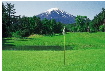
河口湖カントリークラブ (ゴルフ事業)