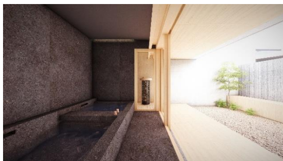
天然温泉・プライベートサウナ（園ラグジュアリースイート）