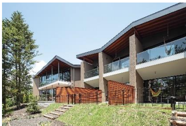
レジナーリゾート軽井沢御影用水 (ホテル事業)

東京建物リゾート公式サイト： https://www.tt-resort.co.jp/