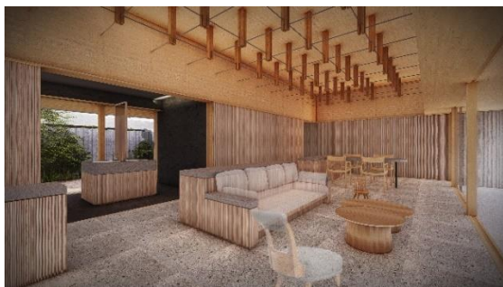
園ラグジュアリースイート

ウッドチップのプライベートドッグランと美しい坪庭からなるプライベートガーデンを従えた天然温泉付きのプライベートヴィラ 10 室は小型犬から大型犬まですべての愛犬同伴での滞在が可能となっており、山や森に続く四季折々の風景をお楽しみいただけます。また、愛犬の事故防止のために、滑りにくく汚れが付きにくい床材を使用するなど、人にとっても愛犬にとっても心地よい滞在になるよう、細部まで配慮した設計としています。