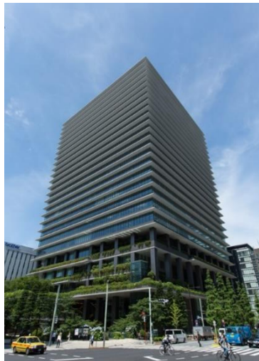
東京スクエアガーデン