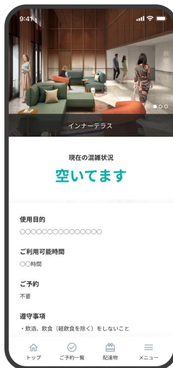
「スミカレジデンスアプリ」イメージ