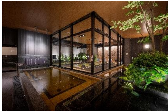
おふろの王様 和光店