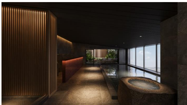
天然温泉大浴場イメージ