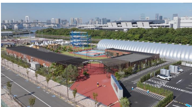
livedoor URBAN SPORTS PARK

Park-PFI事業としては、2023年に都立公園として初のPark-PFI事業となる「都立明治公園」が開園しています。開園後においても、国立競技場の目の前という立地を生かしたさまざまなイベントを開催するなど地域のにぎわい創出に取り組んでおり、2025年の年間来園者数は290万人を突破しています※3。