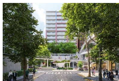
博多駅側からエントランスゲートを望む

博多駅側の公園入り口には、立体的な花壇によるエントランスゲートを計画しています。藤本壮介氏の監修による立体園路や広場等公園全体と調和したデザインとしており、「九州の陸の玄関口・博多駅前に相応しい顔」として来園者を迎えます。