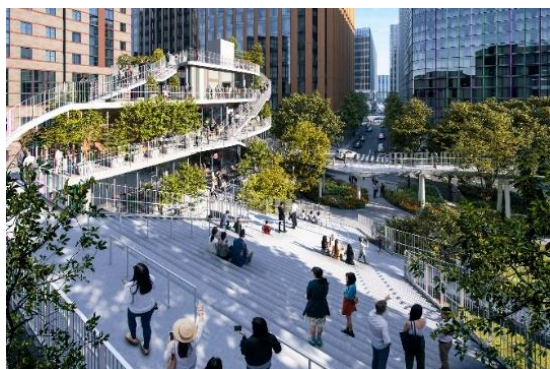
「縁のにわ」から店舗棟を望む

誰もが利用しやすい施設設計や、立体的かつ複合的な魅力あふれる空間デザインにより、周辺施設と一体となったにぎわいの連続性を生み出します。また、上りたくなる屋外階段、居心地の良いテラス、行ってみたいくなる屋上広場など、店舗利用者のみならず誰もが楽しめるオープンスペースを整備します。