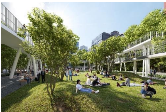
「野々にわ」・「立体園路」

公園全体を一体的かつ統一的に再構成、周辺環境と調和した計画とし、公園利用者に新たな体験価値・ライフスタイルを提供する「5つの広場」と「立体園路」を整備します。