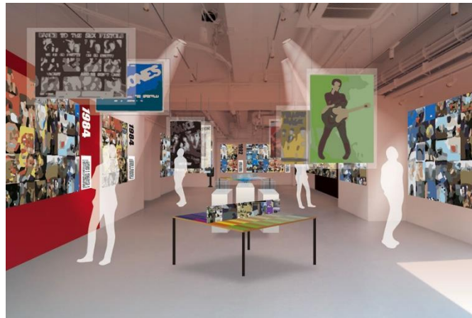
「+1」展示の様子（イメージ）

「洋楽ロック変革期」の7年間（1978年-1984年）におけるビジュアル表現の変遷を年代ごとに辿り、デザイン性の高いレコード・ジャケット約300枚を展示します。また、写真家のトシ矢嶋氏が英国滞在中にコレクションした貴重なポスターや、洋楽の日本盤レコードに固有の帯（通称：タスキ）の展示も行います。