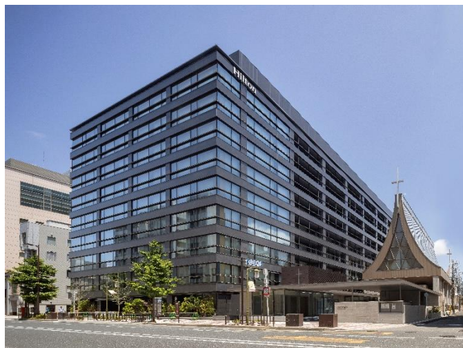
本ホテル外観 ※写真中央の建物