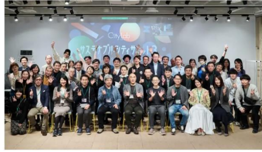
昨年のサミットの様子