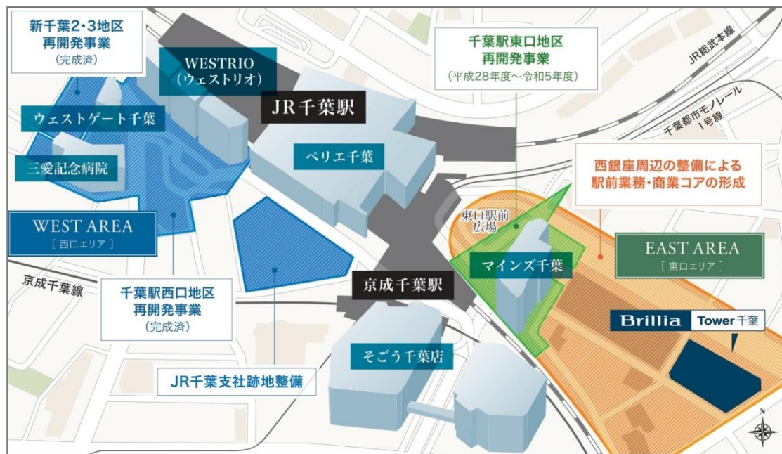
千葉駅周辺再開発概念図

※1 https://www.city.chiba.jp/toshi/toshi/toshinseibi/chibaeki_gd.html