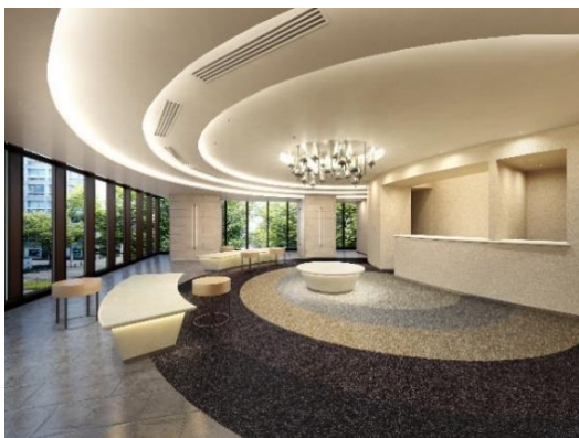
エントランスラウンジ (イメージ)

2階にはエントランスラウンジ、フィットネスルーム、ゴルフレンジ、マルチスタジオ、近隣住民も利用できるコワーキングスペースを配置。3階には、ゲストを迎えるオーナーズスイート2室とパーティールームを配置するなど、居住者の多様なライフスタイルを演出します。