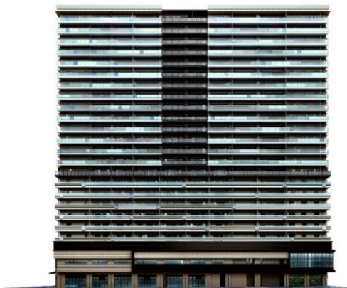
北側建物外観（イメージ）

低層部では街のにぎわいを演出する木調の大庇を設けました。中上層は、空を映し出し、風景に溶け込むガラス手すりを採用することで、周辺への圧迫感を軽減しています。