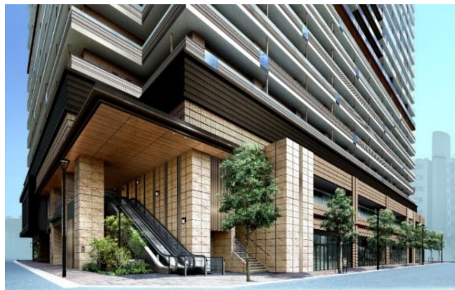
住居エントランス部分（イメージ）