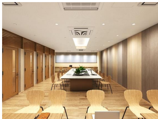
コワーキングラウンジ (イメージ)