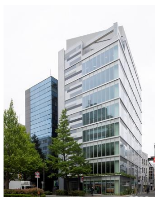
T-PLUS 仙台広瀬通 (2023年4月竣工)