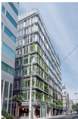
T-PLUS 日本橋小伝馬町 (2022年4月竣工)