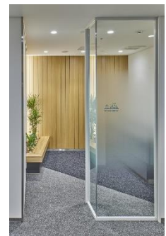
リフレッシュコーナー