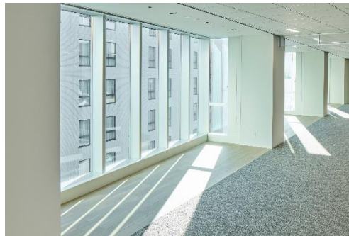
インナーバルコニー