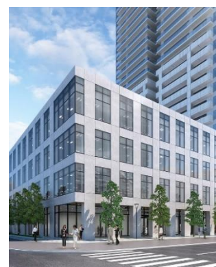
T-PLUS 札幌 (2023年12月竣工)